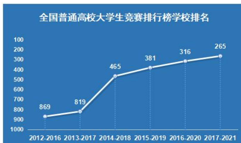
图2 衢州学院学科竞赛全国排名情况

本学年学校大学生学科竞赛继续保持良好态势，获省级三等奖以上奖项622项，其中A类学科竞赛250项。我校在中国大学生工程实践与创新能力大赛中荣获一等奖，连续五年获全国大学生金相技能大赛一等奖、连续五年获全国大学生化工设计竞赛一等奖及以上奖项、连续四年获全国大学生化工实验大赛一等奖及以上奖项、连续两年获全国科学教育专业师范教学技能创新大赛一等奖，2022年荣获全国机械创新设计大赛一等奖，全国大学生生命科学竞赛一等奖，中国高校智能机器人创意大赛国家特等奖。根据中国高等教育学会统计的2017-2021年学科竞赛排行榜，我校在全国1200多所高校中位列第265名，在600多所新建本科院校中位列22位。学校在全国高校机器人竞赛指数（本科）中位列TOP10%-15%。