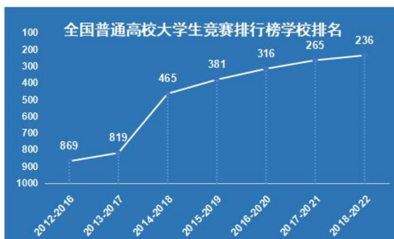
图2 衢州学院学科竞赛全国排名情况

学校持续做实“导师+项目+团队”育人模式，全力提升学科竞赛育人质量，优化学科竞赛结构布局，获省级三等奖以上奖项493项，其中A类和普通高校大学生竞赛排行榜竞赛项目获省级三等奖及以上335项。我校连续七年获全国大学生金相技能大赛一等奖、连续五年获全国大学生化工实验大赛一等奖及以上奖项、首获中国国际“互联网+”大学生创新创业大赛国家银奖、首获浙江省“挑战杯”全国大学生课外学术科技作品金奖，在中国高校智能机器人创意大赛中获四项一等奖。根据中国高等教育学会高校竞赛评估与管理研究专家工作组发布《2022全国普通高校大学生竞赛分析报告》，我校在全国1200多所高校中位列第236名，在670多所新建本科院校中位列17位。学校在全国高校机器人竞赛指数（本科）中位列TOP5%-10%。